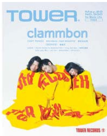
TOWER 300 号表紙

タワーレコード全店でも、今回のニューアルバム「2010」の発売に合わせ、5 月 18 日(火)より店頭にて大展開を行い、「TOWER.LIVE!!2×clammbon」のコラボレーションを盛り上げてまいります。