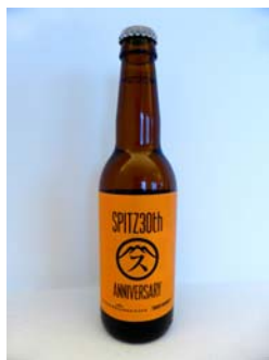
「SPITZ 30th ANNIVERSARY CAFE」オリジナルラベルビール