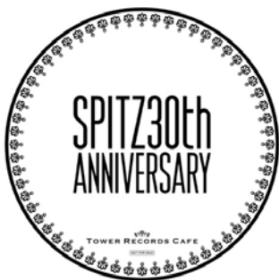
「SPITZ 30th ANNIVERSARY CAFE」コースター

※本リリースに記載の内容は、変更・追加される場合がありますので、あらかじめご了承ください。