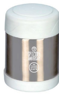
SPITZ 30th ANNIVERSARY × TOWER RECORDS CAFE フードポット

・ SPITZ 30th ANNIVERSARY クリアボトル（ロゴ・銀/500ml） 価格：1,512 円（税込）