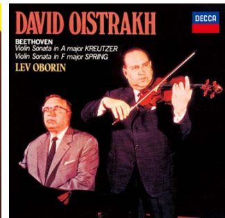
ダヴィッド・オイストラフ 「ベートー ヴェン：ヴァイオリン・ソナタ 第 9 番 《クロイツェル》、第 5 番《春》」