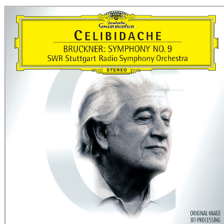
セルジュ・チェリビダッケ 「ブルックナー：交響曲 第 9 番」