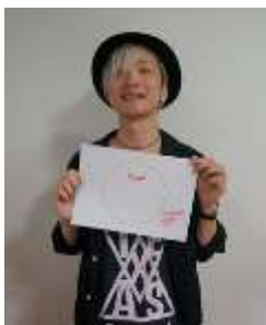
ナカヤマシンペイ (ストレイテナー)