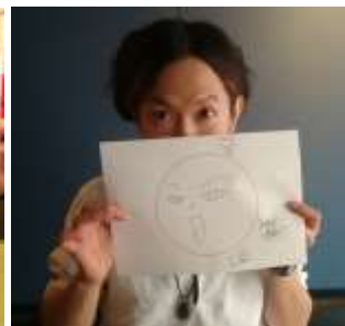
w-shun (KNOCK OUT MONKEY)