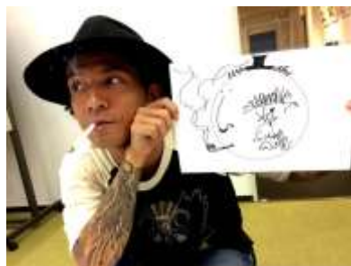
KJ (Dragon Ash)