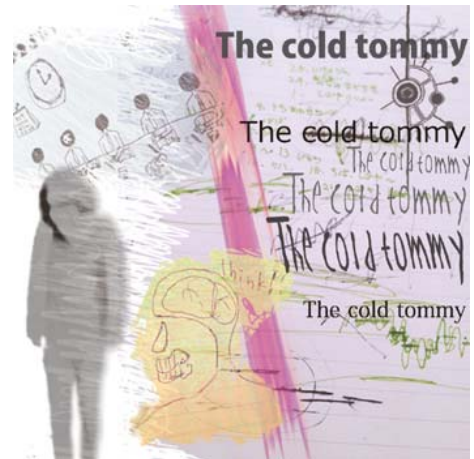
ニューシングル「パスコード」 ジャケット

<ご取材ならびにこの件に関するお問い合わせ先> タワーレコード株式会社 広報室 谷河(やがわ)、高橋、松本、伊早坂 TEL : 03-4332-0705 Email : press@tower.co.jp