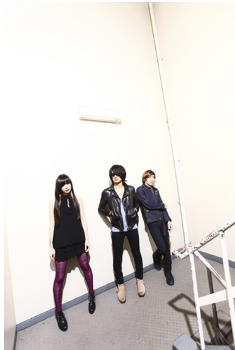
a flood of circle